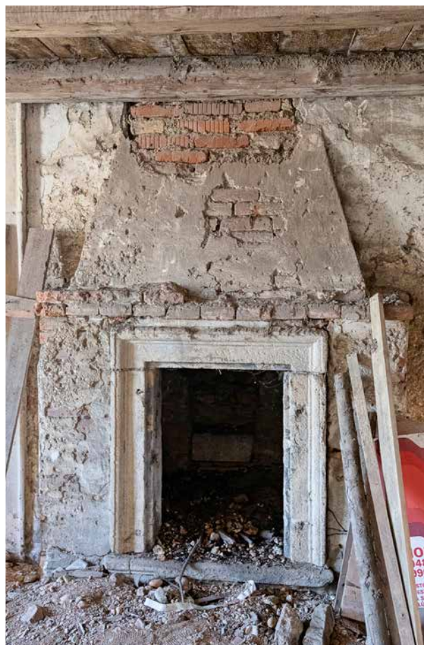
Obr. 7a. Kaceřov, zámek. Celkový pohled na jižní krb v reprezentačním sále východního křídla.

vzory pro kompozici kuchyňského krbu s volutovým štukovým rámcem na pyramidálním dymníku nalezneme u korintského krbu v Regole generali (spodní část) či u čtyř krbů dle italského způsobu v Il settimo libro (pyramidální nástavec). 37 Samotný štukový ornament uprostřed dymníku se inspiroval Serliovými vzory již jen volně a jako celek jej snad lze přičíst invenci kaceřovského umělce či jiné neznámé předloze. 38 Tento přístup je ostatně plně v intencích Serliových doporučení, jež v případě menších detailů opakovaně nechávaly svobodný prostor individuálnímu uměleckému ztvárnění.