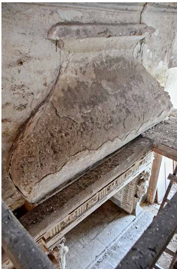
Obr. 6. Kaceřov, zámek. Dymník velkého krbu v reprezentačním sále východního křídla, pohled shora.