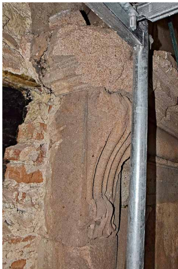
Obr. 2a, b. Kaceřov, zámek. Krb v prvním patře severního křídla, levá konzola.

S novým vlastníkem nastalo nejzářnější období v dějinách kaceřovského statku a zejména velkorysá přestavba stávajícího sídla na „moderní“ zámek. Korespondencí s českou královskou komorou lze doložit intenzivní stavební činnost od jara roku 1540 až do roku 1563. Ferdinand povoloval zvyšovat zástavní částku vždy na základě přesného vyúčtování investic. Ty směřovaly zejména do přestavby středověké tvrze, která zde stála snad již ve druhé polovině 14. století. 3 Jejím nejvýznamnějším pozůstatkem je věž, prostupující v celé výšce východní části severního křídla renesanční novostavby. 4 Jako zámek je objekt poprvé zmíněn v roce 1544. Zástavní suma se do roku 1563 zvýšila z původních 2 750 kop českých grošů na závratnou sumu 13 585 kop. 5 V roce 1549 muselo být jedno, patrně východní křídlo zámku téměř hotovo, jak napovídá objednávka kmenů pro stavbu krovu. 6 Poté se zřejmě pokračovalo výstavbou jižního křídla, což dokládá letopočet 1552 na dnes již nedochovaném dymníku krbu v kuchyni. 7 Do roku 1549 je dále datován údaj v povolovacím majestátu, zmiňující „stavění nemalé k bezpečnějšímu bytu“ na Kaceřově, což snad můžeme dát do souvislosti s výstavbou důmyslného opevňovacího systému zámku, na jehož realizaci muselo Gryspekovi záležet zvláště po událostech roku 1547, kdy byl na krátkou dobu uvězněn protestantskými stavy jako exponent Ferdinanda I. 8 V roce 1558 se uvádí v urbáři, že zámek Kaceřov „jest všecken z gruntu nově znamenitým nákladem velikým vystavěn“. 9