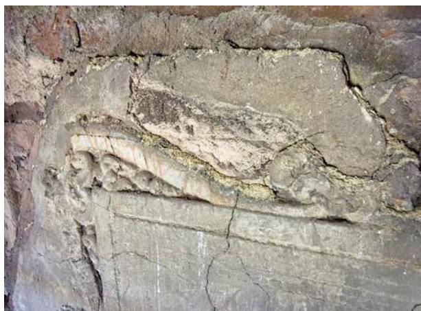
Obr. 3c. Kaceřov, zámek. Krb v prvním patře severního křídla, detail části štukového zrcadla s rytým rámováním a štukovým nástavcem.

Štukovou výzdobu měl možná ještě krb ve velkém sále západního křídla, u nějž Carl Laužil uvádí, že štukové