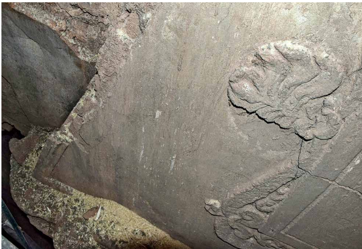
Obr. 4. Kaceřov, zámek. Krb v prvním patře severního křídla, detail poškozené palmety a rámu na východní straně dymníku.

pravouhlým profilovaným odstupňovaným ostěním, jež je zdobeno dvěma řadami perlovce. Na něm spočívá soudkovitý vlys. Pískovcovou římsu podpírají navíc po stranách dvě stojky s volutovými konzolami pokrytými listy s akanťovým přívěskem (obr. 2a, b). Na ní stojí zděný dymník, na hranách s maltovým rámem, v jehož středu se nachází velká plocha zrcadla, rámovaná čtvercovou štukovou lištou s volutami a palmetami (obr. 3a, b). Dle provedených sond se ve středu štukového zrcadla nenacházela žádná výplň, ani letopočet. 23 Patrně je však ryté rámování na vnitřní straně štukové kartuše (obr. 3c). Palmety a zřejmě i další náročnější štukové plastické články byly nalepeny do připraveného maltového lože na povrchu dymníku (obr. 4). Jeho povrch byl později několikrát přebílen. Samotný dymník dlátovitého tvaru je do hloubky velice subtilní.