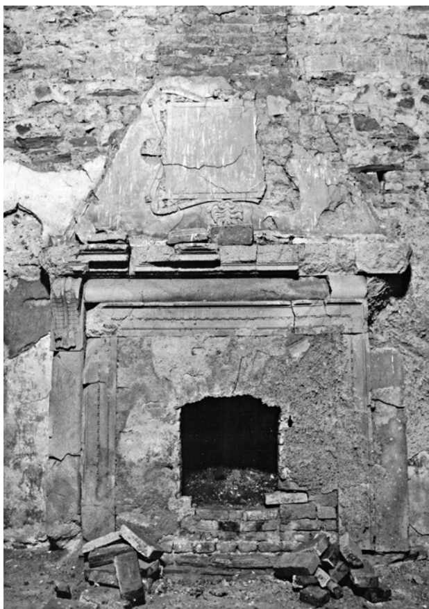
Obr. 3b. Kaceřov, zámek. Krb v prvním patře severního křídla, pohled na krb od západu.

Co se interiérového vybavení týče, jsou výtvarné kvality shledávány zejména ve výjimečně skupině bohatě zdobených krbů, jejichž dymníky nesly v nejednom případě štukovou výzdobu (obr. 1). Z dvanácti honosných krbů se do dnešních dnů bohužel dochoval jen zlomek (nejcelistvěji dva krby ve velkém sále východního křídla), přičemž ty se štukovou výzdobou jsou dnes ztraceny zcela. 14 Představu o jejich vzhledu si tak můžeme učinit již jen z fotodokumentace či starších nákresů. 15 Náročný vytápěcí systém zámku doplňovala původně vedle krbů také kachlová kamna, která se ovšem žádná nedochovala. 16 Většina z nich se nacházela v obytném prvním patře. Typologicky můžeme rozdělit krby do dvou skupin: první sestává z krbů s architektonicky řešenou představenou konstrukcí dymníku s kladím a konzolami, 17 druhou skupinu tvoří pouhé niky ve zdi s jednoduchým ostěním a křbovou římsou. 18 Římsy, konzoly, ostění krbů a v jednom případě i architektonizovaný nástavec byly z pískovce, pláště dymníků z omítnutého cihelného zdiva a někdy také s ornamentální štukovou výzdobou, rámuující malířský či sgrafitový dekor. 19