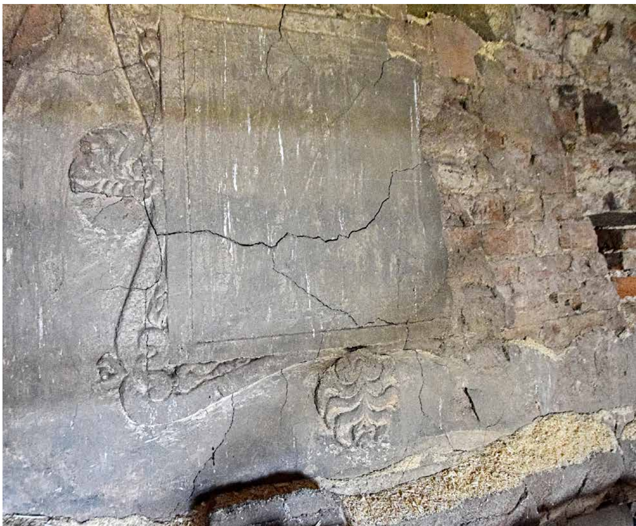
Obr. 3a. Kaceřov, zámek. Krb v prvním patře severního křídla, čelo dymníku se štukovým rámem a palmetami.

tohoto období se datuje začátek postupného chátrání zámku, např. k roku 1785 je uváděn propadlý strop západního sálu. V dalších letech, kdy bývalý klášterní majetek přešel do správy Náboženského fondu, se stav zámku výrazně zhoršoval. Klášter Plasy i s Kaceřovem následně v roce 1826 zakoupil rakouský státní kancléř Klement Václav Metternich-Winnenburg a Metternichové pak drželi kaceřovský zámek téměř sto let, od roku 1826 do roku 1922. Za nich se honosné prostory prvního patra využívaly jako sýpka a skladiště sena. 11 V přízemí byla obecní škola. Z důvodu statiky musela být snesena barokní báhň z věže a později byla v roce 1875 snížena i výška věžního zdiva. Kvůli zcizování železných táhel byly také oslabovány konstrukce zavěšených stropů. Chátrání budovy vyvrcholilo devastujícím požárem v roce 1912. 12 Nevalný zájem majitelů o zámek a s tím související absence stavebních úprav paradoxně způsobily, že se stavba do dnešní doby dochovala ve víceméně původní renesanční dispozici.