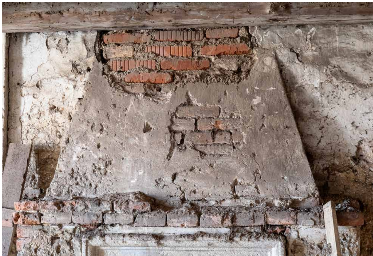
Obr. 7b. Kaceřov, zámek. Malý krb v reprezentačním sále východního křídla, detail čela dymníku s rytým rámováním zrcadla. (Foto M. Micka, 2021)

tvůrce architektonické koncepce musel pocházet z pražského dvorského prostředí. 41 Tento vztah v jistém smyslu podporuje drobný detail, zvlněný tvar u krbového nástavce v hlavním sále na Kaceřově, který se zcela vymyká serliovskému pojetí 42 a jenž je miniaturní zmenšeninou střechy Letohrádku královny Anny (obr. 6). 43 Štuková výzdoba krbových nástavců na Kaceřově patřila pak mezi nemnoho unikátů (podobně jako na zámcích v Kratochvíli nebo Jindřichově Hradci) mezi dochovanými příklady renesančních krbů v Čechách, kde před rokem 1600 stále převažovala kamenická tradice. 44